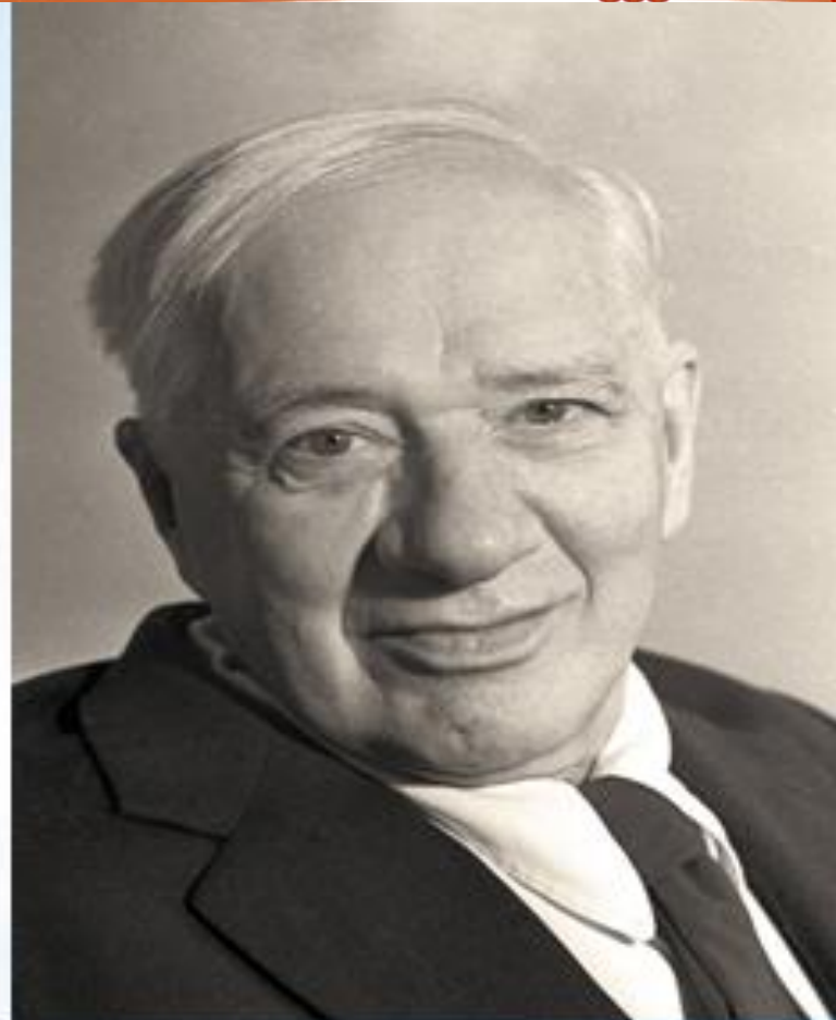
Корней Иванович Чуковский